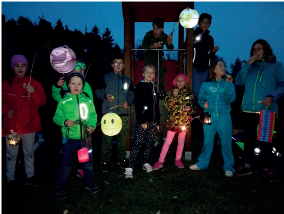
Lampionový průvod 8. 11. 2018